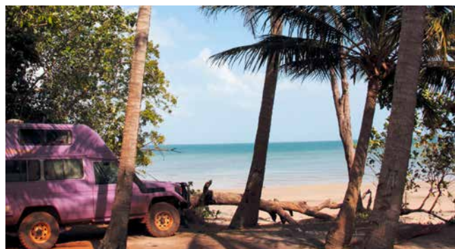
Am Ende des Old Telegraph Track