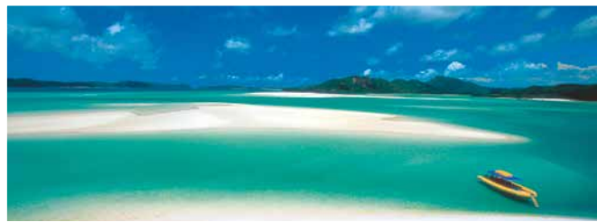
Traumhafter Strand auf Whitsunday Island