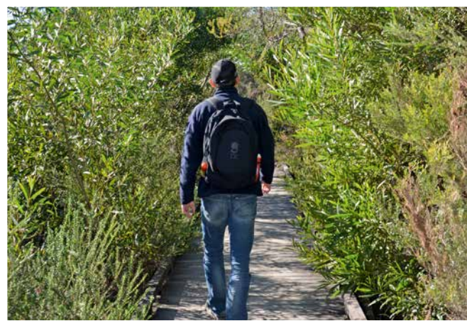
Wanderung in Sydney