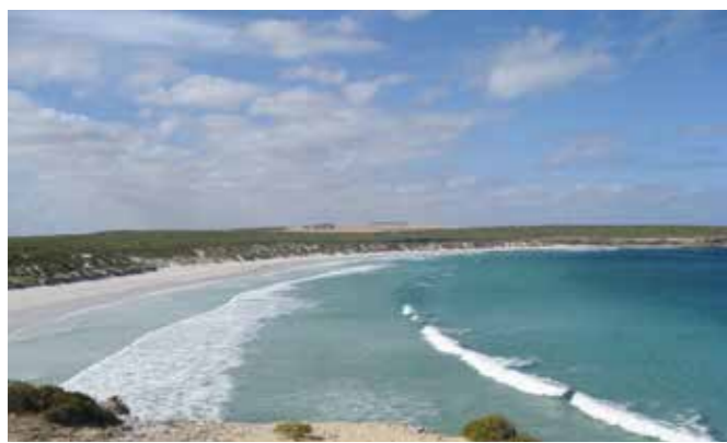
South Australia – Eyre Peninsula