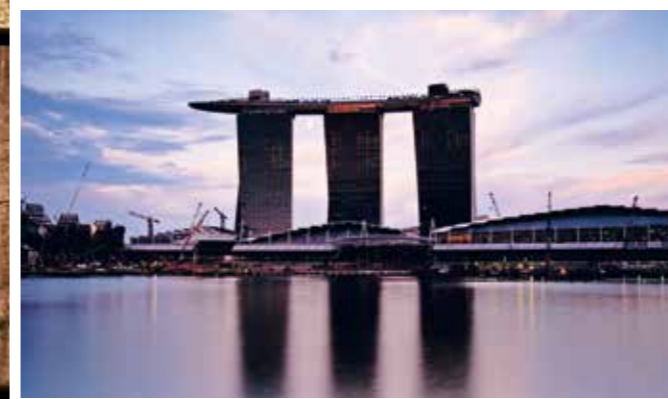
Stopover in Singapur

Plädoyer gegen ein Vorurteil: Singapur bietet weit mehr als moderne Hochhäuser und klinische Sauberkeit. Der 1819 gegründete Stadtstaat ist ein pulsierender Schmelztiegel zwischen Moderne und Tradition. Die Mega-City bietet eine erstaunliche kulturelle Vielfalt mit Tempeln und Moscheen ebenso wie mit guten Einkaufsmöglichkeiten, faszinierenden Hotels und abenteuerlichen Attraktionen. Nah am Äquator gelegen, ist ein Zwischenstopp in der Tropenmetropole auf dem Weg nach Australien unbedingt ratsam. Christian Dose war dort.